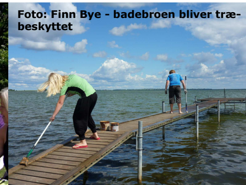
badebroen bliver træbeskyttet