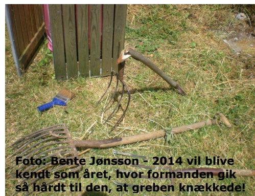
2014 vil blive kendt som året, hvor formanden gik så hårdt til den, at greben knækkede!