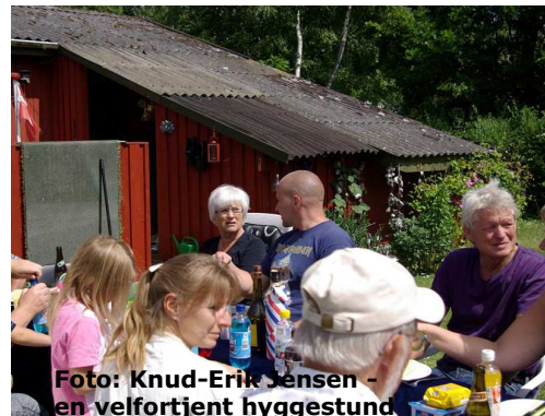
en velfortjent hyggestund

Så husk at møde op til næste år. Det er den anden lørdag i juni, så sæt allerede nu kryds i kalenderen. Mød din nabo på en anderledes måde til lyden af børnenes leg og arbejdende redskaber - og vær med til at holde omkostningerne nede på kontingentet. Det du laver frivilligt, skal en professionel ikke have løn for at udføre.