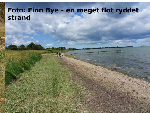
en meget flot ryddet strand